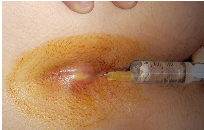
L'anesthésie est faite lentement à la surface cutanée.